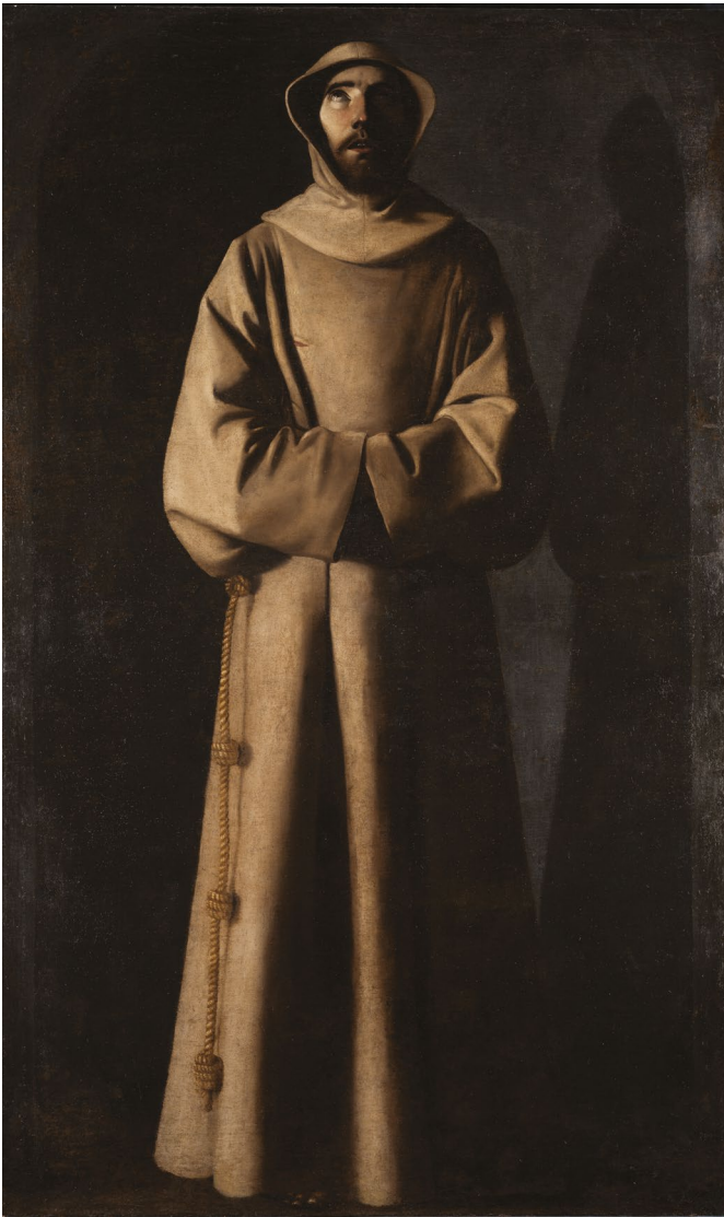
Francisco de Zurbarán San Francisco de Asís según la visión del papa Nicolás V. hacia 1635-1640, óleo sobre lienzo Barcelona, Museu Nacional, d'Art de Catalunya