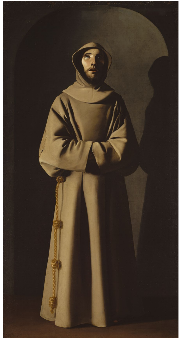
Francisco de Zurbarán San Francisco hacia 1640-1645, óleo sobre lienzos Boston, Museum of Fine Arts Herbert James Pratt Fund. Inv. 38.1617